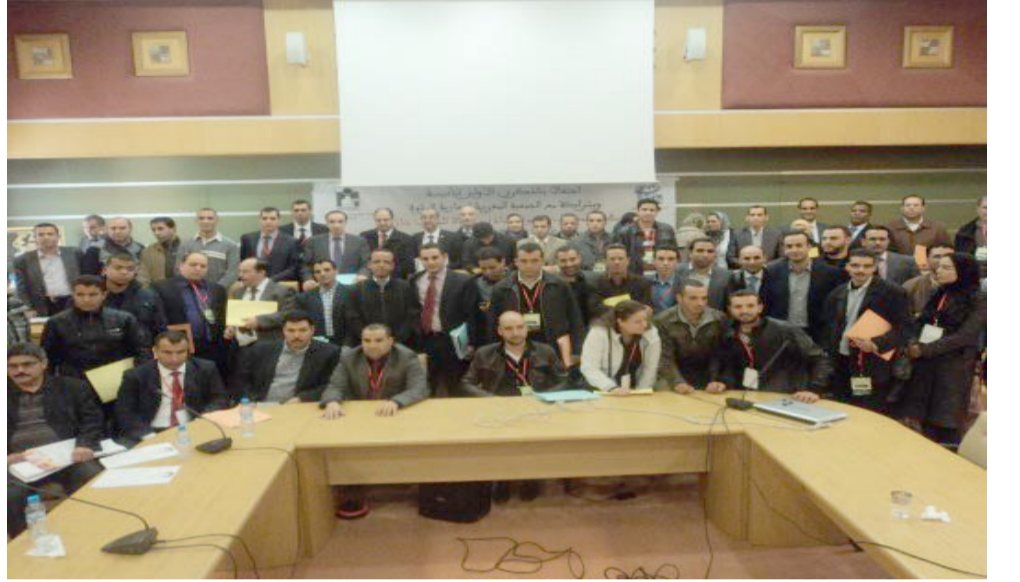
خارجه مهمتها اقتصرتها مهمتها