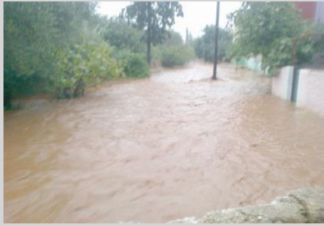
شهد حي آيت بوطيب بتاهلة- إقليم تازة عشية هذا اليوم الأحد 18 نونبر سيلا من

الأمطار كادت تغرق الحي بأكمله في ظل ضعف البنيات التحتية بالحي، حيث داهمت مياه الأمطار الغزيرة بعض المنازل بالحي ما جعل المواطنين يسرعون لإنقاذ ما يمكن إنقاذه.